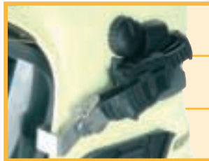
Adaptersystem für Vollmasken