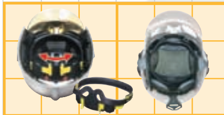
Ratschensystem mit schneller Größeneinstellung