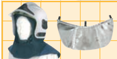
Aluminisierter Nomex- oder feuerfester Wollneckenschutz