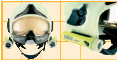
Integrierte Lampenhalterung auf beiden Seiten